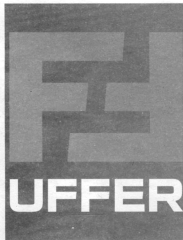
Chegl è igl nov logo dallas treis interpresas dalla firma «Uffer».