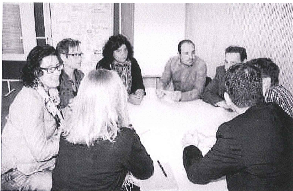
An gruppas è nia discurreia e fatg propostas scu catar soluziuns per dar alla regiun daple veta aint igl turissem e la hotellareia.